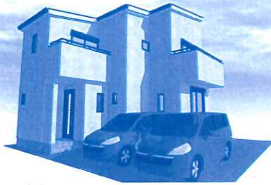
(建築外観イメージ)